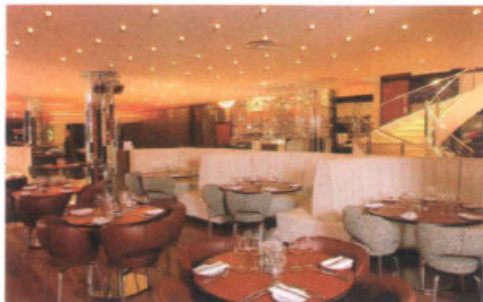
Se ha tratado de mantener la estética del local original