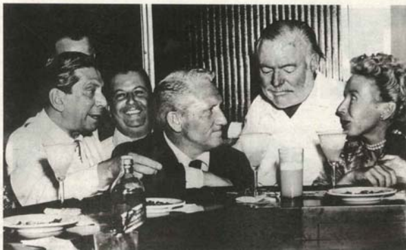
ASIDUOS. Spencer Tracy y Ernest Hemingway (centro), en la barra del Floridita de Cuba.