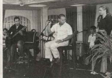
MÚSICA. El grupo cubano Buena Fe actúa esta noche en Marbella.